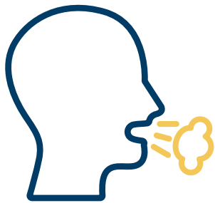
Tos / Estornudo